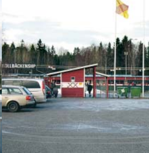
Snön ligger ännu djup på Trollbäckens IPs gräsplan, men inne på rinken är det full fart. Nu ser det dock ut som om alla aktiviteter får tak över huvudet – hallar planeras för ishockey, fotboll och friidrott. Men ännu finns ingen tidsplan och åtgärderna brådskar.