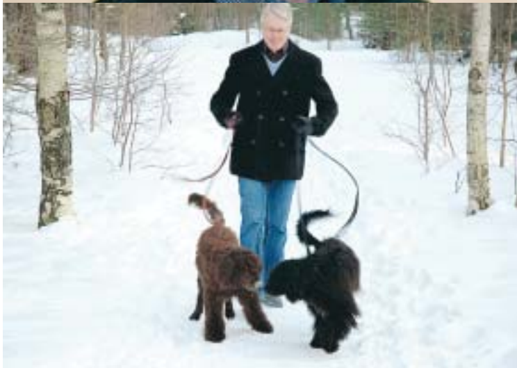
Ett glatt sinnelag och förmågan att hålla många bollar i luften är till hjälp både i politiken och i privalivet.