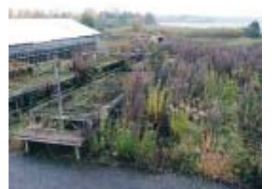
Plantskola för vanligt folk?

Håll vad som lovats! En som trodde på borgarna