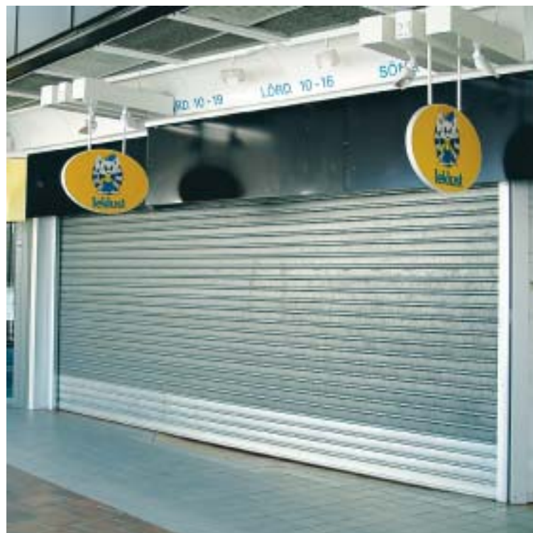
Ridån har gått ned för barnens favoritaffär.

För dig som vill veta mer; Tyresö kommuns hemsida www.tyreso.se Sök: Tyresömodellen.