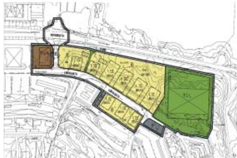
KARTA: STADSBYGGNADSKONTORET TYRESÖ