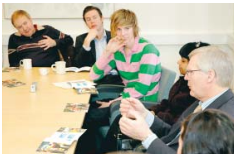
Bosse Ringholm trivdes på Tyresös fina gymnasium och uppskattade elevernas engagemang.

Bosse Ringholm visade på skillnaden mellan moderat skattepolitik, var att den förre moderatledaren Bo Lundgren lovade en skattesänkning på 120 miljarder, något som han ivrigt togförde. Den nye moderatledaren Fredrik Reinfeldt lovar skattesänkningar