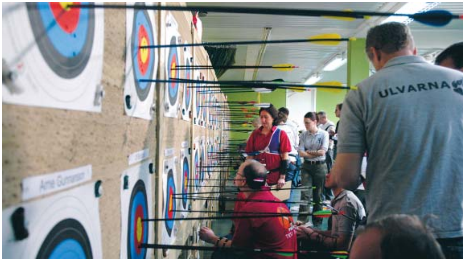
Under Tyresöhelgen gästades kommunen av delar av den svenska bågskytteeliten.