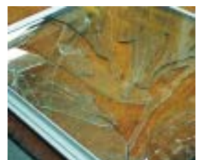
Pangade "doror" är bara en liten del av vad en glasmästare måste kunna fixa i dag.

■ Ett samarbete mellan Tyresö Nyheter och Tyresö gymnasiums medieklasser presenteras. Sid 12